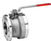
Art. A.0485F CAST DIAMOND