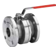
Art. A.1006F CAST TOPAZ