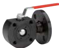
Art. A.0380 JADE 3W-CS