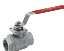
Art. A.0416 TENAX-WP