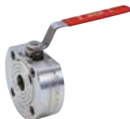
Art. A.0455 JADE-SS