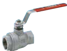
Art. A.0410 TENAX