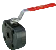
Art. A.0450 JADE-CS