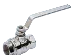
Art. A.0420 SAPHIR