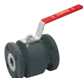
Art. A.1008 TOPAZ-CS

Valvole a sfera a passaggio totale in acciaio al carbonio e acciaio inox AISI304 o AISI316L.