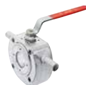
Art. A.0464 JACKET JADE-SS