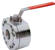
Art. A.0485 DIAMOND-SS