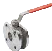
Art. A.0445 CAST JADE

Valvole a sfera a passaggio totale in acciaio al carbonio e acciaio inox AISI304 o AISI316 in versione fusa, che garantiscono oltre che ad un risparmio economico anche una maggiore leggerezza per un montaggio più rapido sull'impianto.